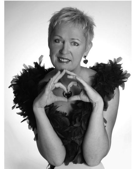
Rat in Liebesdingen? Fragen Sie Frau Lioba. Am 15.5. im unikum!