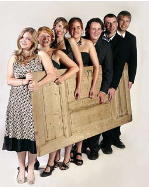
Bitte schön: „Danke für die Tür“ am 29.1. um unikum auf Bühne 1.

„Inside out“ heißt es wieder am 5.2., wo das out bei freiem Eintritt alles auf die Bühne schmeißt, was noch rausmuss: Theaterschnitzchen, Lesung, Tanz, Musik, und alles gipfelt zum Schluss in einer rauschenden Party.