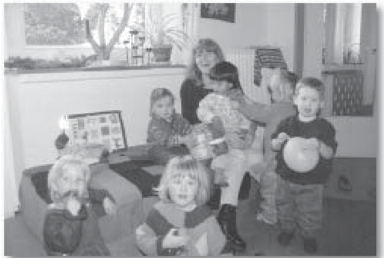
„Was machst Du da?“ Eine Gruppe aus der Kinderkrippe Huntemannstraße

Daneben bietet das Studentenwerk Oldenburg für Studierende mit Kindern seit Jahren besondere Wohnheimplätze an, die mit entsprechenden Kinderspielmöglichkeiten ausgestattet sind. Für studentische Mütter mit Kindern steht eine besonders ausgestattete Wohngruppe zur Verfügung, die auch die räumlichen Rahmenbedingungen für eine gemeinschaftliche Kinderbetreuung bietet.