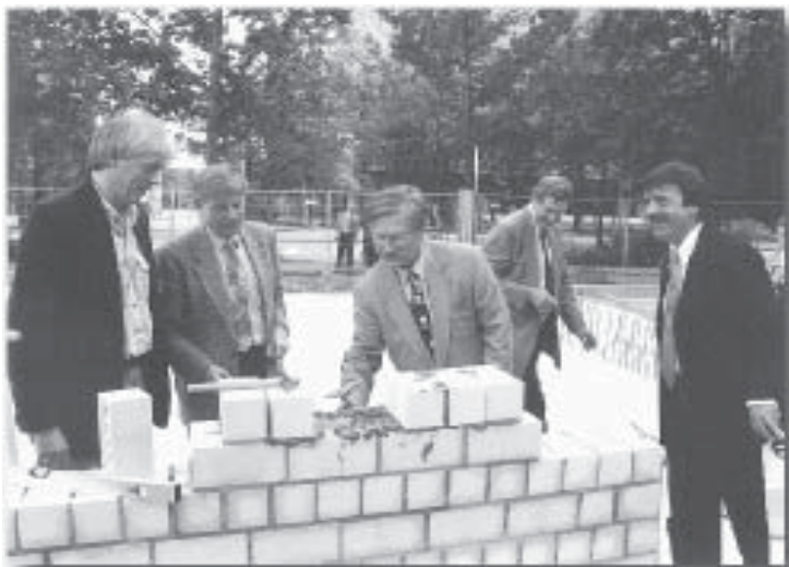
Grundsteinlegung mit Geschäftsführer Kiehm, Stadtbaurat Schutte, Bürgermeister Nehring, Universitätspräsident Daxner und Umweltminister Jüttner

1998 fiel endlich der Startschuß für die Errichtung des „Ökologischen Dienstleistungszentrums an der Universität Oldenburg“, kurz Ökologiezentrum. Nach einer längeren Planungsphase konnte im Sommer mit dem Bau begonnen werden. Zur offiziellen Grundsteinlegung für das Gebäude