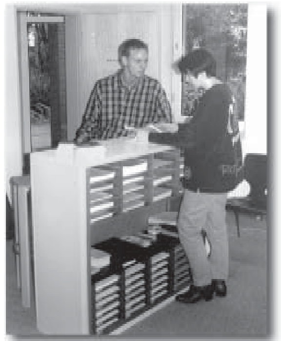
Das neu eingerichtete Servicebüro der Förderungsabteilung

Das neu eingerichtete Service-Büro wurde sofort stark genutzt