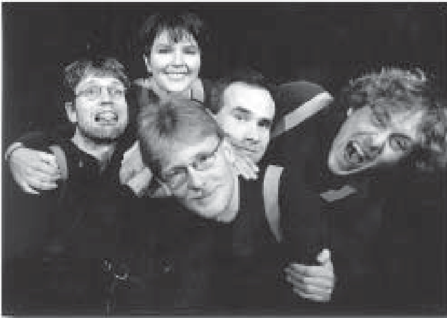
Auch 1997 wieder im UNIKUM: Das Oldenburger Eigengewächs SPUNK

zu nutzen, um sich in einer künstlerisch forschenden Weise mit der Welt auseinanderzusetzen. Bei den Mitgliedern des OUT ist zudem der Ensemblegedanke mehr und mehr in den Vordergrund gerückt. Statt der bisherigen, recht einseitigen Fixierung auf die Arbeit in der eigenen Gruppe hat sich bei den Theaterschaffenden das Gefühl entwickelt, Teil eines einzigen, größeren Theaters zu sein. Die Zusammenarbeit auf