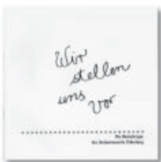
Die Kinderkrippe Oldenburg erstellte diese Broschüre, in der das pädagogische Konzept des Teams vorgestellt wird

An zwei Standorten unterhält das Studentenwerk Kinderkrippen in der Nähe der Hochschuleinrichtungen. In Oldenburg ist die Betreuungsstätte im Wohnheim Huntemannstraße eingerichtet. Hier stellen wir seit dem Umzug der Kinderkrippe von der Ammerländer Heerstraße 46 Plätze für Kinder von Studierenden zur Verfügung. Auf einer Ebene existieren hier Räumlichkeiten zum Spielen, Kuscheln, Schlafen und Essen für 46 Kinder in zwei Krabbelgruppen, die sowohl vormittags als auch nachmittags genutzt werden. Der Garten, der die Studentenwerkskrippe großflächig umgibt und gegen den Straßenverkehr abschirmt, bietet zudem beste Spiel-, Sport- und Tobemöglichkeiten. Neben der Kinderkrippe stellt das Studentenwerk zudem die Räumlichkeiten für den in Elternträgerschaft befindlichen Kindergarten „Küpkersweg“ bereit.