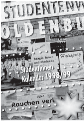
Der neu gestaltete (und im Original farbige) Titel des Studentenwerkskalenders

bis zu 35.000 Seitenaufrufe unserer Internetseiten monatlich