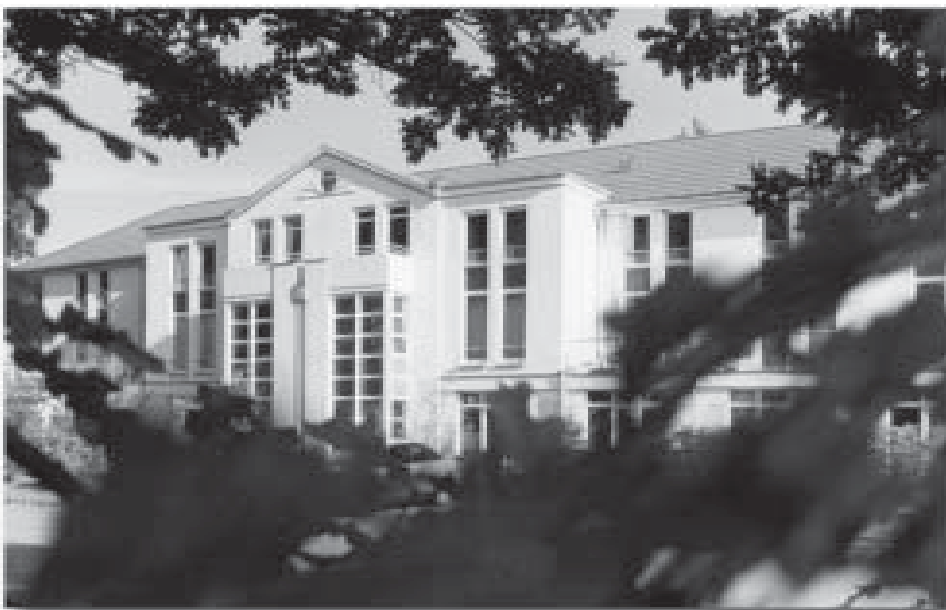
Wohnheim Artillerieweg in Oldenburg

Für nur 8 Mark monatlich unbegrenzt in das Internet