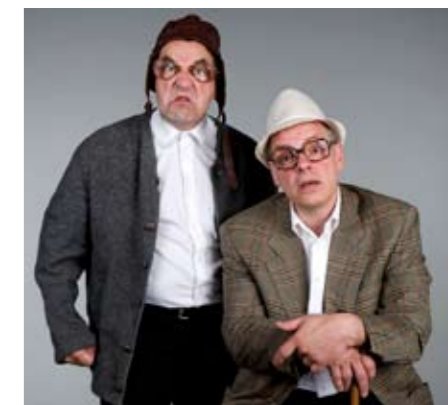
Mit der „Buschtrommel“ ins „Lobbyland“: am 19.11. im unikum.

In unserer letzten Ausgabe hatte sich in einem Teil der Auflage im Artikel „Mensa Elsfleth eröffnet“ der hinterlistige Fehlerteufel eingeschlichen. In dem Artikel hieß es, die Mensagäste speisten mit Blick auf die Weser. Genau genommen muss es natürlich statt Weser Hunte heißen. Wir bitten, dieses Versehen zu entschuldigen.