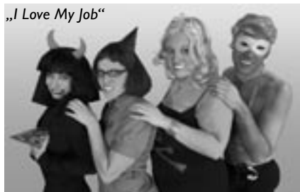
„I Love My Job“

beginnt eine abenteuerliche neuzeitliche Odyssee! Am 17.11.2007 dürfen dann die Theaterbesucher einmal der Boss sein. Das Improtheater „12 Meter Hase“ ist auf die Mithilfe der Zuschauer angewiesen. Wie heißt es so schön im Theatersport? Alles ist möglich und die Schauspieler werden eingezählt: „5-4-3-2-1: los!“ Ab dem 2.12.2007 ist das out dann unterwegs. Mit